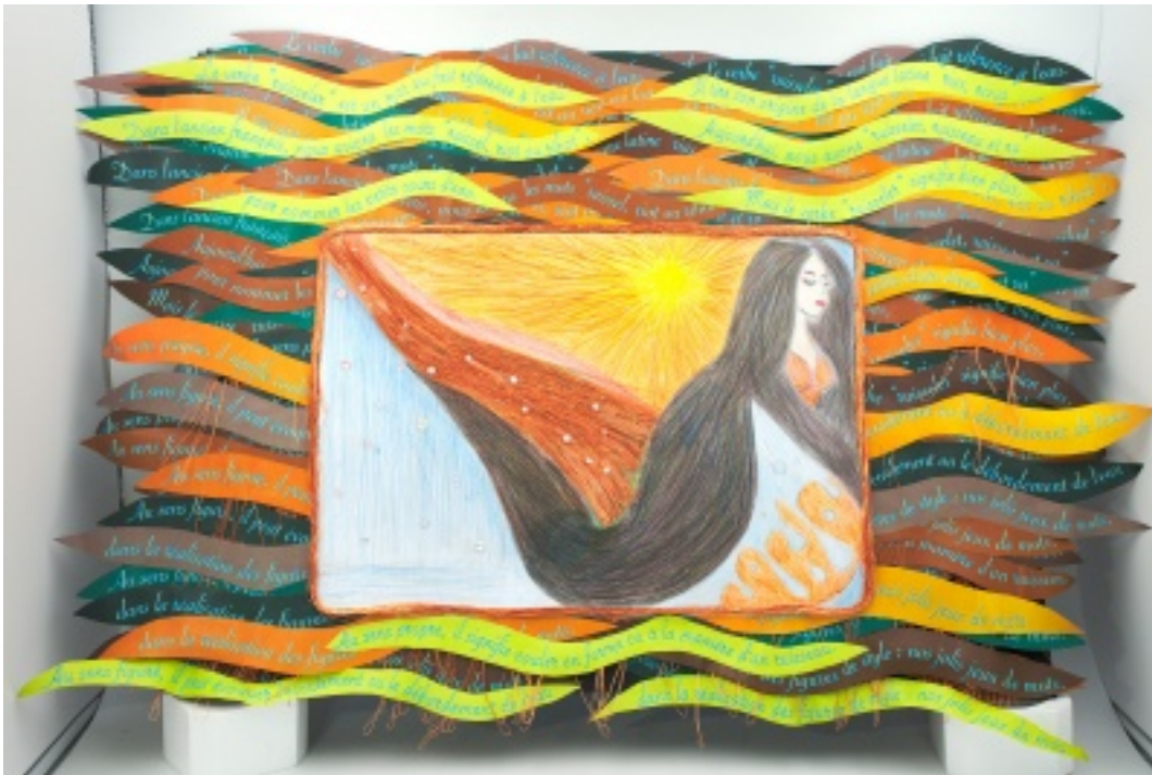
Photo œuvre lauréate concours hôpitaux - ruisseler, par Malika EDDHABI