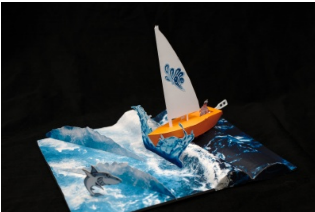
Photo œuvre lauréate concours hôpitaux - spitant, par Jérôme ALLAIRE