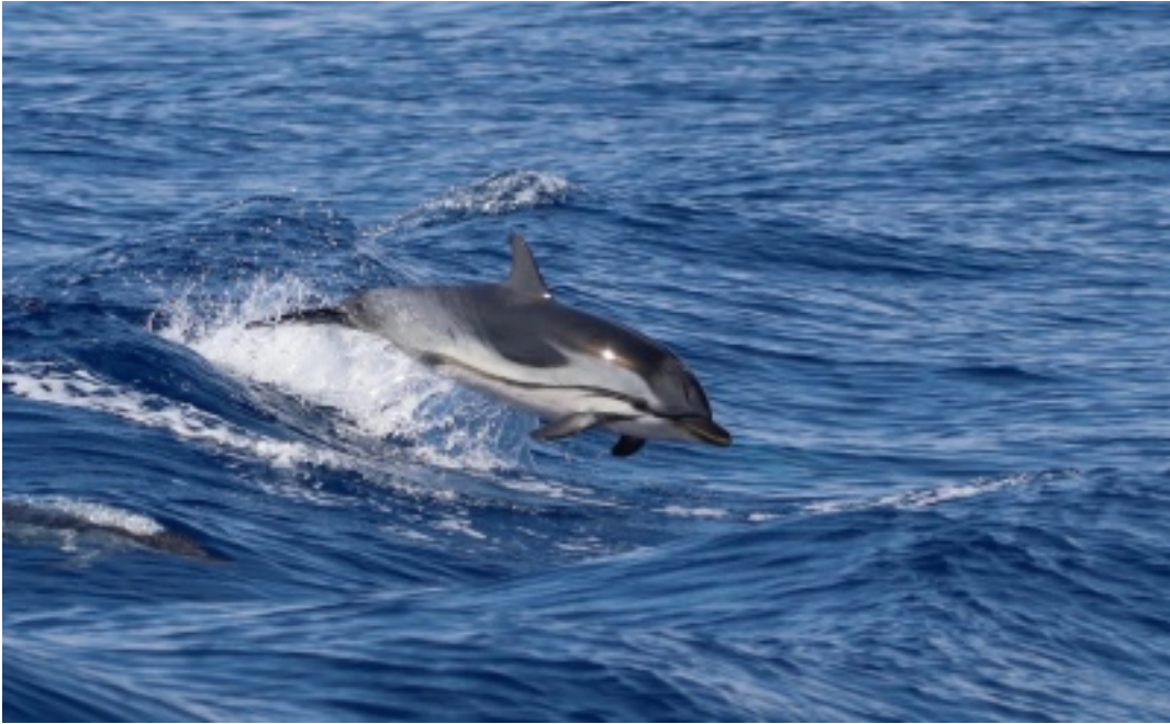
Photo œuvre lauréate concours hôpitaux - fluide, par Dan STEFANESCU