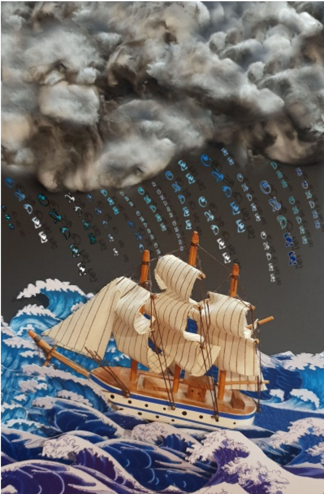
Photo œuvre lauréate concours hôpitaux - ondée, par Audrey TERNISIEN