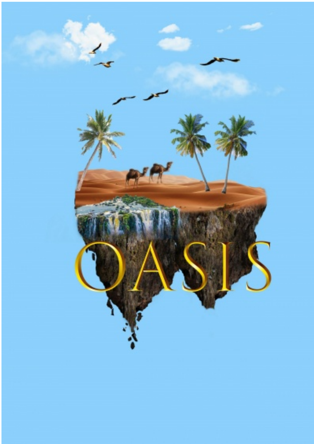
Photo œuvre lauréate concours hôpitaux - oasis, par Aboubakry GANDEGA