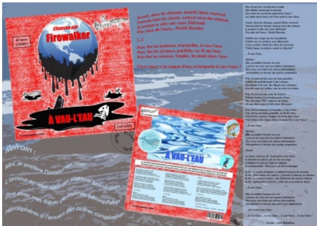
Photo œuvre lauréate concours hôpitaux - à vau-l'eau, par Yann BATAILHOU