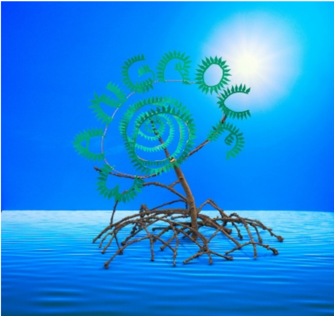
Photo œuvre lauréate concours hôpitaux - mangrove, par Virginie ROULLEAU