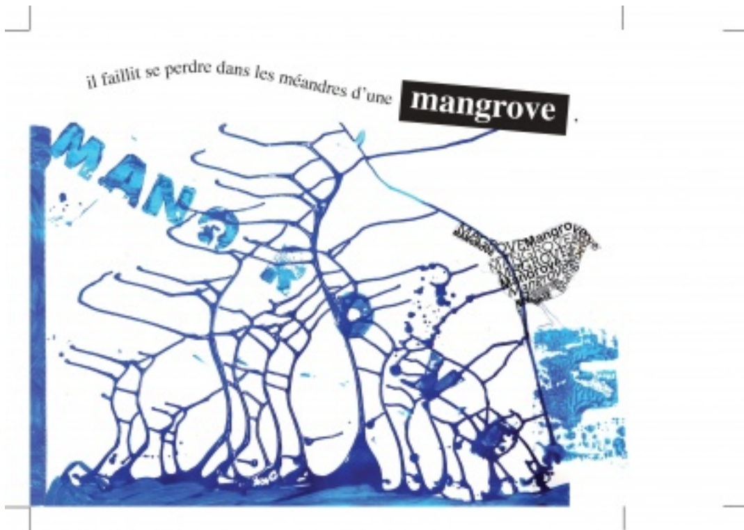
page_9.jpg, par Eleves UPE2A du LP A. AYMARD

Nous vous proposons de découvrir le texte rédigé par les élèves. Une histoire proche de leur vécu , une volonté de transposer une réalité très difficile en une histoire positive, un besoin d'y croire.