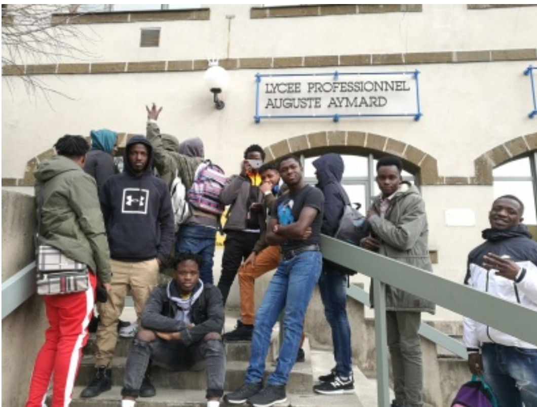
photo_upe2a_4.jpg, par Eleves UPE2A du LP A. AYMARD

Ce travail leur a demandé beaucoup d'investissement personnel , ils ont dû dépasser leurs craintes du « je n'en suis pas capable », mais le résultat les a rendus fiers d'eux-mêmes.