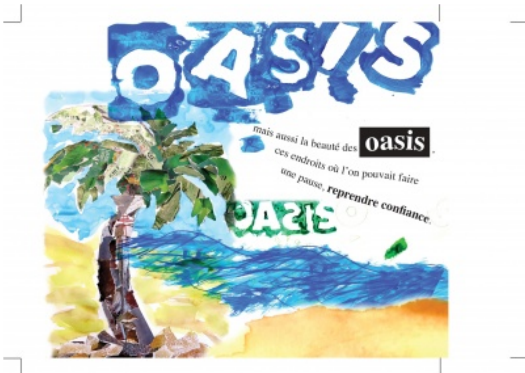
page_7.jpg, par Eleves UPE2A du LP A. AYMARD

Nous vous proposons de découvrir le texte rédigé par les élèves. Une histoire proche de leur vécu , une volonté de transposer une réalité très difficile en une histoire positive, un besoin d'y croire.